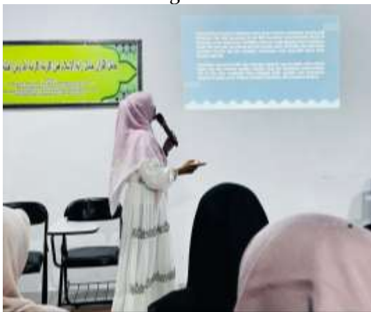
Gambar 3. Penyampaian Materi dari Narasumber Ke 2

Sesi kedua dalam program pelatihan difokuskan pada penguatan teknik dasar public speaking sebagai fondasi utama dalam membangun komunikasi kepemimpinan yang efektif. Materi diawali dengan pembahasan mengenai kecemasan komunikasi ( communication apprehension ) yang kerap dialami mahasiswa saat tampil di depan umum. Kecemasan ini umumnya ditandai dengan gejala fisiologis seperti jantung berdebar, suara gemetar, dan pikiran menjadi kurang fokus. Oleh karena itu, fasilitator memperkenalkan strategi pengendalian diri melalui teknik pernapasan diafragma ( deep breathing technique ) dan relaksasi singkat sebelum berbicara. Pendekatan ini sejalan dengan temuan Deha (2023) yang menyatakan bahwa pelatihan teknik dasar secara intensif, khususnya latihan pengelolaan kecemasan dan kontrol vokal, terbukti meningkatkan performa komunikasi mahasiswa secara signifikan.