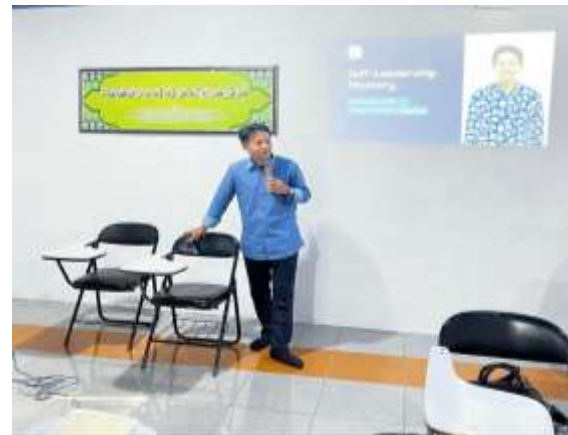
Gambar 2. Penyampaian Materi dari Narasumber Pertama

berkontribusi signifikan terhadap pengembangan karier dan kepemimpinan seseorang.