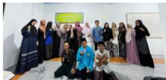
Gambar 4. Foto Bersama Narasumber dan Mahasiswa

Berdasarkan hasil observasi, terjadi peningkatan signifikan dalam aspek keberanian dan kelancaran berbicara peserta. Jika pada tahap awal sebagian peserta masih bergantung pada teks dan terlihat ragu-ragu, pada sesi leadership challenge mereka mulai menunjukkan kepercayaan diri yang lebih kuat serta kemampuan menyampaikan gagasan secara spontan dan terstruktur. Hal ini menunjukkan bahwa latihan intensif berbasis tantangan mampu memperkuat kesiapan mental dan keterampilan komunikasi kepemimpinan mahasiswa. Dengan demikian, integrasi praktik, simulasi, dan tantangan kepemimpinan dalam pelatihan menjadi strategi efektif dalam membentuk karakter komunikatif dan adaptif pada mahasiswa.