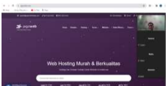
Gambar 2. Masuk ke Dalam Website Penyedia layanan Domain dan Hosting

Pelatihan pengenalan cara berlangganan website untuk kepentingan pribadi kepada siswa SMP Yanuri Cengkareng dilaksanakan dengan memanfaatkan pendekatan online. Berikut adalah hasil dan pembahasan dari pelaksanaan pelatihan, sebagian besar siswa SMP Yanuri Cengkareng berpartisipasi aktif dalam pelatihan online. Mereka terlibat dalam diskusi, menanyakan pertanyaan, dan mengikuti instruksi dengan baik. Partisipasi aktif siswa menunjukkan minat mereka dalam topik pengenalan cara berlangganan website. Pendekatan online memberikan fleksibilitas bagi siswa untuk belajar dari mana saja dengan akses internet, sehingga meningkatkan keterlibatan mereka dalam kegiatan. Penggunaan pendekatan online memungkinkan penyampaian materi yang jelas dan terstruktur. Siswa dapat memanfaatkan sumber daya online yang tersedia, seperti video tutorial dan panduan online, untuk memperdalam pemahaman mereka. Sebagian besar siswa mampu mengaplikasikan pengetahuan yang diperoleh selama pelatihan dalam situasi nyata, yaitu saat berlangganan website untuk kepentingan pribadi. Didalam penyampaian pengenalan ini siswa diarahkan untuk membuka suatu website penyedia layanan web dan hosting suatu domain. Dapat terlihat dari Gambar 2.