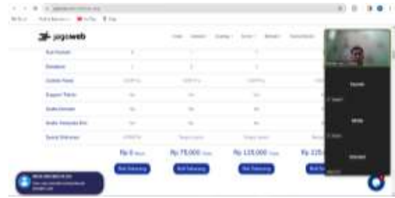
Gambar 3. Memilih Jenis dan Kapasitas Website

Kemudian siswa dapat diarahkan untuk membuat akun mereka sendiri untuk mereka dapat memesan dan membeli suatu nama domain dan juga hosting yang mereka inginkan.