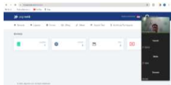
Gambar 4. Masuk Kedalam Akun Panel Website Pribadi

Kemudian siswa diajak untuk langsung memilih dan mengkalkulasi apa yang mereka butuhkan dalam pembuatan website pribadi ini.