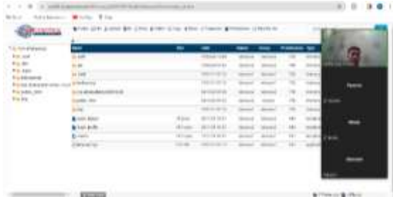
Gambar 7. Fitur Email dalam Website Pribadi

Selanjutnya dalam gambar 7, siswa diajari bagaimana cara membuat email yang bisa langsung ada pada website yang dibeli sehingga mempermudah komunikasi dengan para pembaca website pribadi tersebut