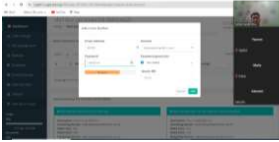
Gambar 6. Fitur Manage File dalam Website Pribadi