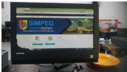
Gambar 1. Dashboard SIMPEG Kab. Jember

dalam mengadopsi dan memanfaatkan SIMPEG secara maksimal. Untuk mengatasi hal ini, diperlukan upaya sosialisasi berkala seperti bimtek dan pelatihan yang komprehensif yang didukung oleh pemerintah daerah. Evaluasi berkala terhadap efektivitas sosialisasi juga penting untuk mengidentifikasi kekurangan dan memastikan pendekatan yang sesuai dengan kebutuhan ASN. Dengan langkah-langkah tersebut, diharapkan kurangnya literasi digital dapat diatasi, mendorong adopsi dan pemanfaatan SIMPEG yang lebih efektif dan efisien, serta meningkatkan efisiensi dan kualitas layanan kepegawaian secara keseluruhan di BKPSDM Kabupaten Jember.